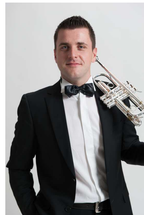
Prima Tromba "Japan Philharmonic Orchestra"